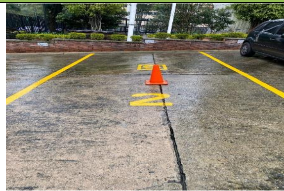
Fotografía 4. Parqueadero Principal 2 ubicado en las instalaciones del Ministerio de Ambiente y Desarrollo Sostenible.