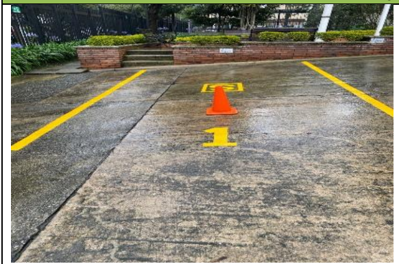
Fotografía 2. Parqueadero Principal 1 ubicado en las instalaciones del Ministerio de Ambiente y Desarrollo Sostenible.