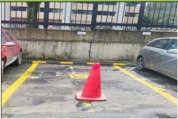
Fotografía 3. Parqueadero Auxiliar 1 ubicado en las instalaciones del Ministerio de Ambiente y Desarrollo Sostenible.