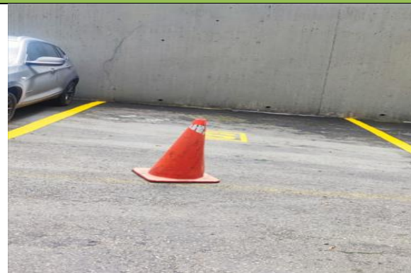
Fotografía 5. Parqueadero Auxiliara 2 (Rampa) ubicado en las instalaciones del Ministerio de Ambiente y Desarrollo Sostenible.